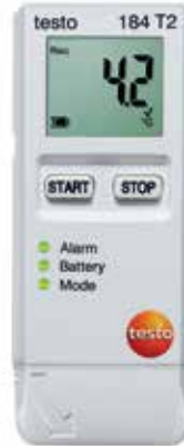
testo 184 T2