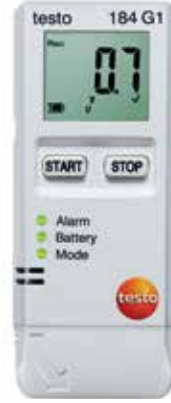
testo 184 G1