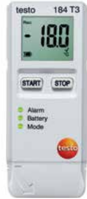
testo 184 T3