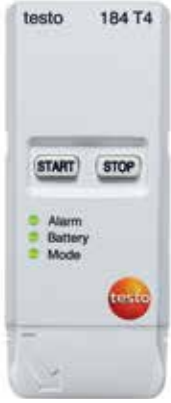
testo 184 T4