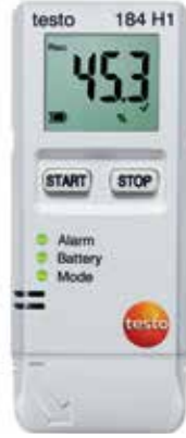
testo 184 H1