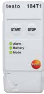
testo 184 T1