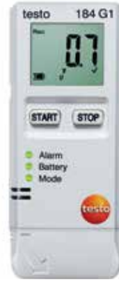
testo 184 G1