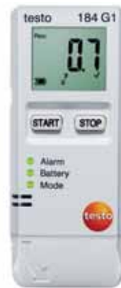
testo 184 G1