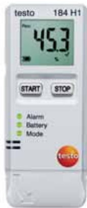
testo 184 H1