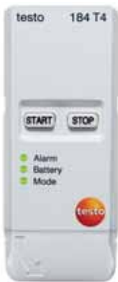
testo 184 T4