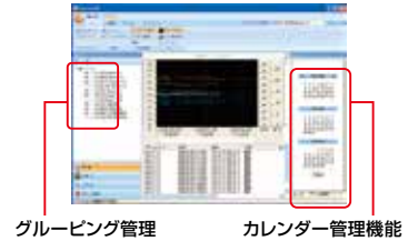
グルーピング管理

testo Saverisプローブ(子機)をフロアごと、部屋ごとなどでグループ分けをし、管理することができます。カレンダー機能と併用すると、確認したい場所や特定期間の測定データを簡単に抽出することができます。