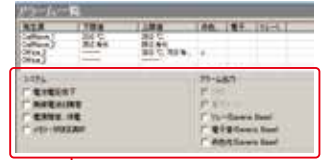
各種アラーム設定ウィンドウ

アラームは、リレー、電子音、赤色灯への出力だけでなく、携帯電話などにメールで通知することができます。