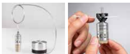
Support de sonde pour lyophilisation