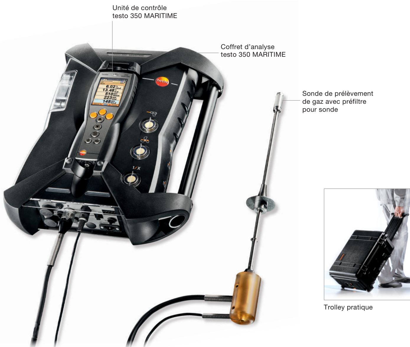
Unité de contrôle testo 350 MARITIME

Le testo 350 MARITIME permet également d'utiliser les mesures NOx comme justificatif dans certaines zones régionales spéciales. P.ex., en Norvège, pour réduire la taxe NOx.