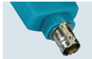
testo 206-pH3: pH3-Sondenkopf mit BNC-Schnittstelle