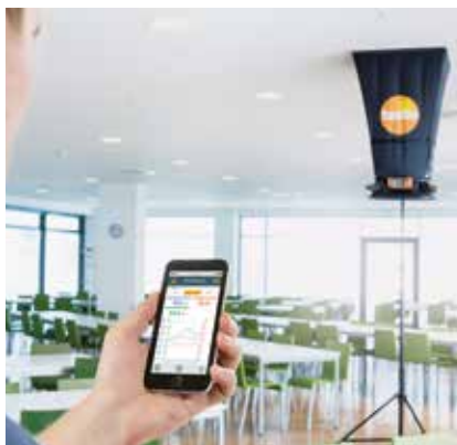
Messung und Protokollerstellung via App