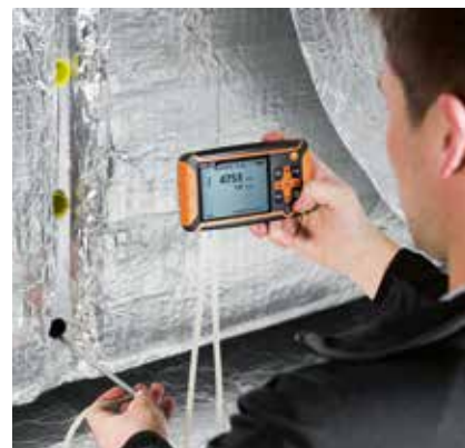
Staurohrmessung im Kanal