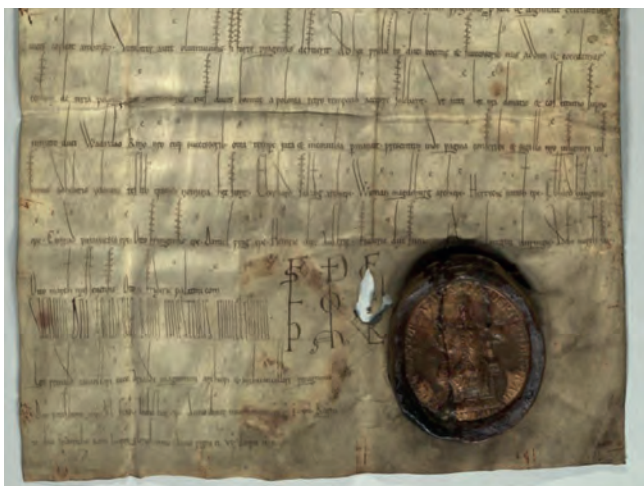
Detail Vladislavova privilegia.