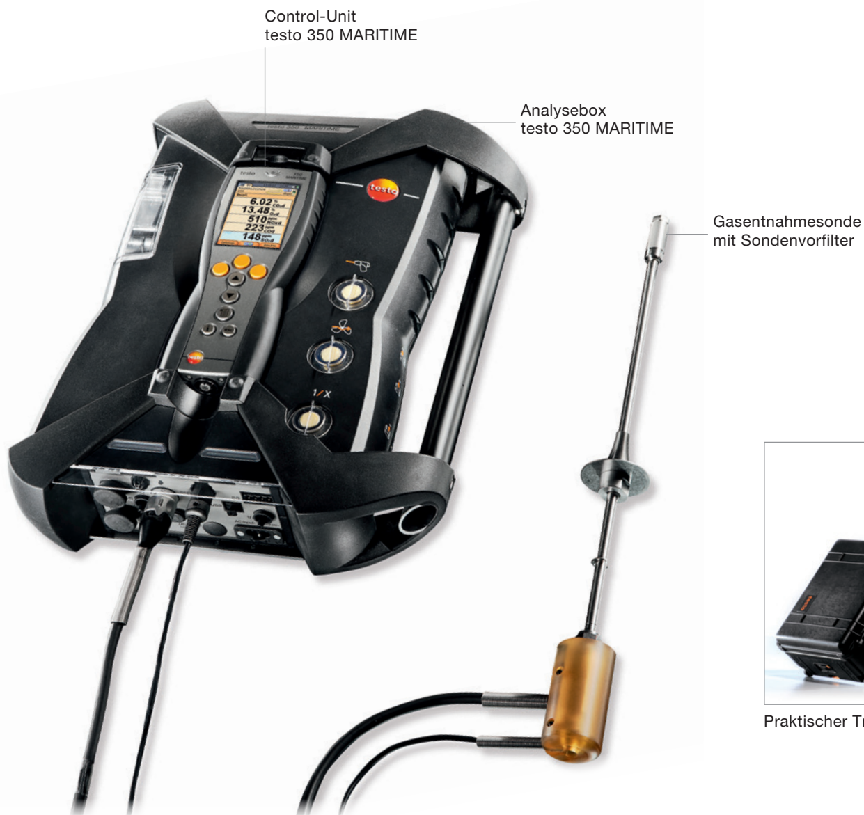
Control-Unit testo 350 MARITIME

Zudem ist mit dem testo 350 MARITIME auch die NOx-Messung als Nachweis in regionalen Sonderzonen möglich. Zum Beispiel um die NOx-Steuer in Norwegen zu reduzieren.