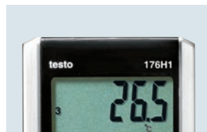
Grosses und übersichtliches Display zur Messwertanzeige