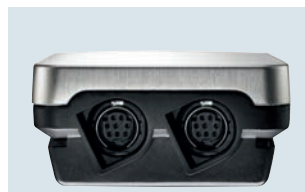
Fühleranschlüsse am unteren Gehäuseende für zwei Temperatur-/Feuchtefühler