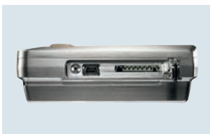
Seitlicher Anschluss von Mini-USB-Kabel und SD-Karte