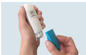
Cambio sencillo de sonda en los testo 206-pH1/-pH2/-pH3