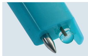
testo 206-pH1: sonda pH1 para líquidos