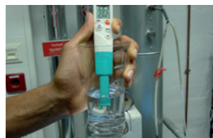
Ideal para comprobación de agua de calefacción conforme a VDI 2035.