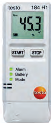
testo 184 H1