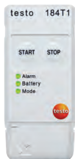
testo 184 T1