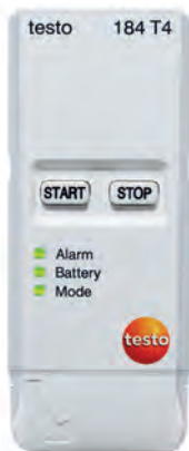
testo 184 T4