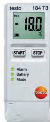
testo 184 T3