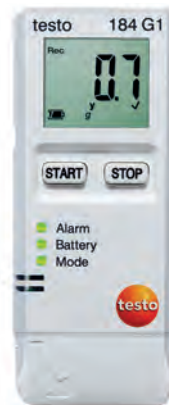
testo 184 G1