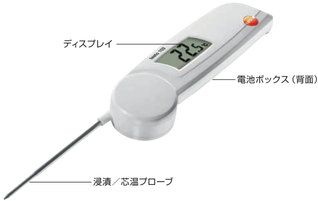
testo103 食品用温度計取扱説明書 0977 1030 J 02 (12.2017)