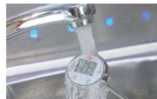
Amennyiben szennyeződne a műszer, folyó víz alatt egyszerűen lemosható