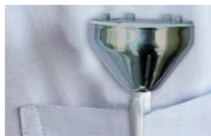
Védőtok és tartó egyben. Mindig kéznél van "bevetésre" készen