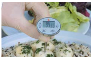
Élelmiszerek szűrőpróba szerű ellenőrzéséhez