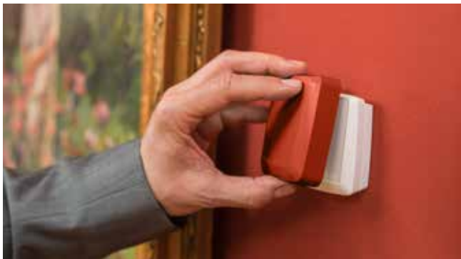
Dankzij deco-covers passen de dataloggers zich aan de omgeving aan