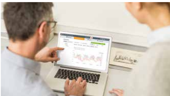
Gegevensanalyse via de Testo Cloud

Aangezien de meetwaarden via WiFi worden verstuurd hebben de testo 160 loggers geen storende kabels nodig die in de voorhanden bouw geïntegreerd zouden moeten worden, wat bij gebouwen onder monumentenzorg wellicht ook helemaal niet mogelijk zou zijn. Dit wordt ondersteund door een van de voortreffelijke eigenschappen van het monitoringsysteem: de dataloggers zijn klein gebouwd met een bijzonder minimalistisch design. En ze hebben een 'deco-cover': voor elke datalogger is een individueel te bewerken afdekking verkrijgbaar. Deze deco-cover kunt u geheel naar wens spuiten, schilderen of beplakken. Zo blijven de loggers op de achtergrond en leiden ze niet af van de stukken.