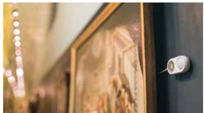
Externe voelers maken een flexibele inzet van het monitoringsysteem mogelijk