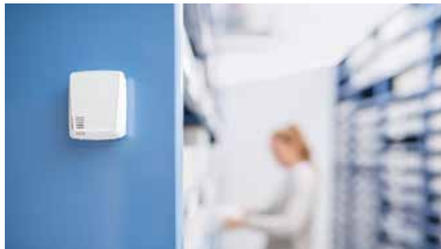
Monitoring in het archief

Er bestaat niet één perfect klimaat voor alle kunstwerken, omdat het altijd de specifieke materiaalsamenstelling van een object is die dit bepaalt. De omstandigheden waaronder keramische voorwerpen, marmeren beelden of bronzen medaillons bewaard dienen te worden, wijken bijvoorbeeld onderling sterk af, zodat het klimaatbeheer van de betreffende omgeving individueel aangepast moet worden. Bijzonder kritiek is het bij organische materialen zoals leer, perkament, papier of hout. Deze zijn hygroscopisch – d.w.z. dat ze een sterke wisselwerking met de luchtvochtigheid vertonen. Bij te droge lucht wordt er vocht aan onttrokken zodat ze gewicht verliezen en krimpen. Een omgekeerde reactie treedt op bij vochtige omgevingslucht. Deze wisselende klimaatvoorwaarden houden de kunstobjecten voortdurend in beweging zodat het slechts een kwestie van tijd is voordat het schilderij op doek scheurt of de verf van sculpturen afbladdert. Maar ook objecten van anorganische materialen, bijv. van metaal of keramiek, kunnen door een ongunstige of sterk schommelende omgevingsvochtigheid beschadigd raken.