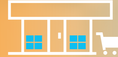
Satış yerleri ve marketler