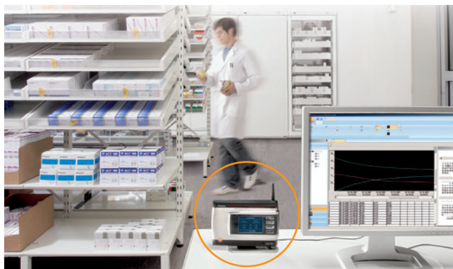
Monitorización de temperaturas de medicamentos en farmacias hospitalarias