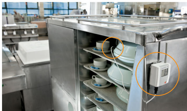
Registro ininterrumpido de temperaturas durante la salida de comidas