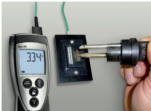
Schnelle und präzise Überprüfung der LötKolbentemperatur.

Änderungen, auch technischer Art, vorbehalten.