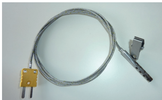
Fühler und Anschlussleitung komplett aus Edelstahl

CAC_CS//1.2017 Änderungen, auch technischer Art, vorbehalten.