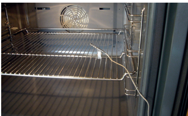
Einfache Positionierung im Backofen mit Befestigungsklammer