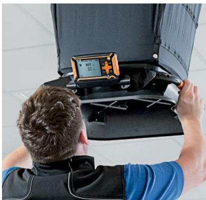
Display inclinabile e rimovibile