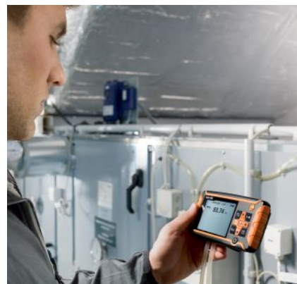
Misura della pressione differenziale con tubo flessibile di collegamento