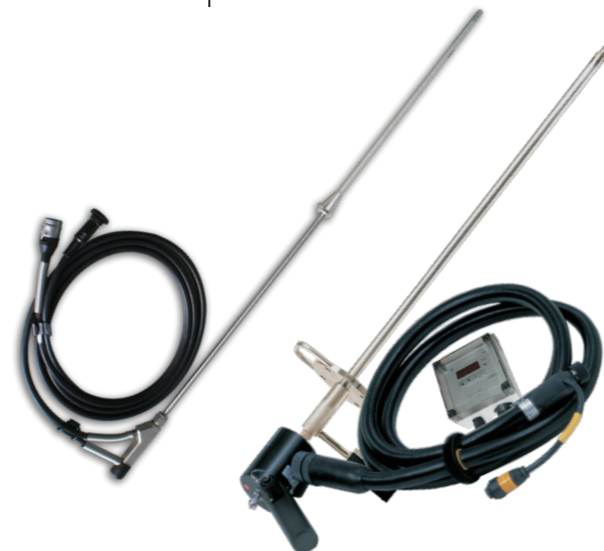
探头订购信息请查看 testo 350 产品资料 P12