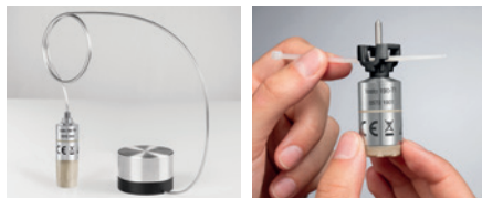
Support de sonde pour lyophilisation